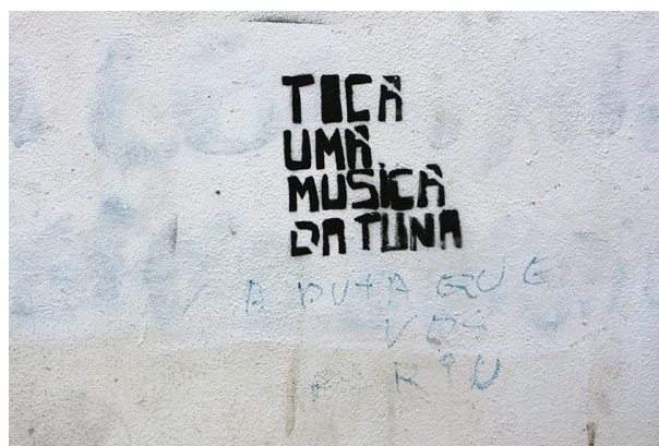
Figura 2. A inscrição ampliada

A ligação à tradição académica traduz-se aqui na escolha dos vocábulos (“praxe”, “tuna”) em duas das três inscrições e fica algo reforçada pela utilização da cor preta nas letras, aludindo às tradicionais capas negras dos estudantes e aos seus trajes académicos. Visto que é raro ouvir as músicas académicas nos bares noturnos junto aos quais este grupo das inscrições se encontra, a primeira inscrição poderia ser interpretada no seu sentido literal do convite para “tocar uma música da tuna”. Por outro lado, a ambivalência da forma imperativa e da indicativa do verbo “tocar” alarga o campo de interpretação permitindo entender a inscrição como uma constatação. Desta forma, a sua intenção comunicativa apontaria para uma tentativa de salientar o contraste irónico entre a tradição académica, com o seu significado central para a identidade de Coimbra enquanto cidade, e as práticas comercializadas da música nos bares daquela cidade.