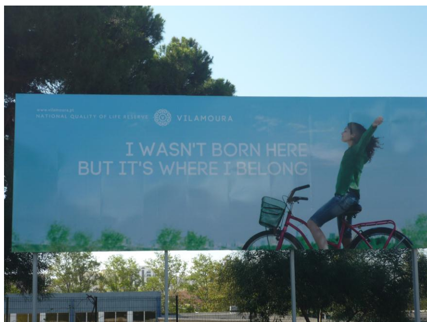
Figura 5. Vilamoura

Um dia num passeio de bicicleta na periferia de Vilamoura, deparei-me com um enorme cartaz na borda da estrada, composto pela imagem de uma mulher jovem de bicicleta, com os braços esticados para cima e os olhos fechados num estado de manifesto sonho extático, acompanhada pelo seguinte texto, aparentemente gravado no céu azul claro acima de uma paisagem verdejante: «I WASN'T BORN HERE BUT IT'S WHERE I BELONG» 8 (Fig. 5).