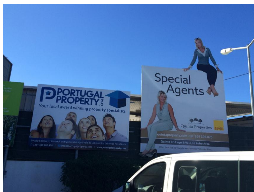
Figura 4. Almancil

Loulé . 7 As cartazes e outdoors bilingues (ou seja, inglês-português) observados empregavam, na sua grande maioria, estratégias para tornar saliente o texto em inglês. Em termos da composição do espaço semiótico, os vários elementos podem ser avaliados com base no seu “peso visual”, que deriva da sua “saliência percetual” (van Leeuwen, 2005: 198), ou seja o grau de captação da atenção da pessoa que vê a composição. Isto cria uma hierarquia de importância entre os elementos da composição, marcando uns como mais merecedores de atenção do que outros. No caso em estudo, a saliência dos textos em inglês é atingida, por exemplo, colocando o inglês em cima ou no topo, ou à esquerda do português, usando uma fonte maior e/ou cores mais brilhantes e visíveis. Assim, a semiótica da paisagem está a transmitir uma mensagem clara sobre o status relativo tanto da própria língua inglesa como daqueles que a falam (Torkington, 2013).