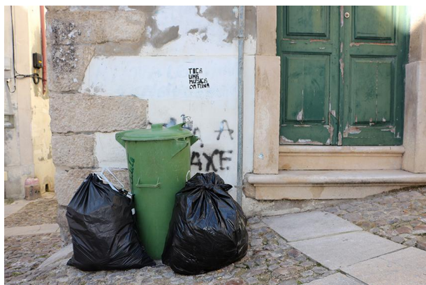
Figura 1. Localização do grupo das inscrições