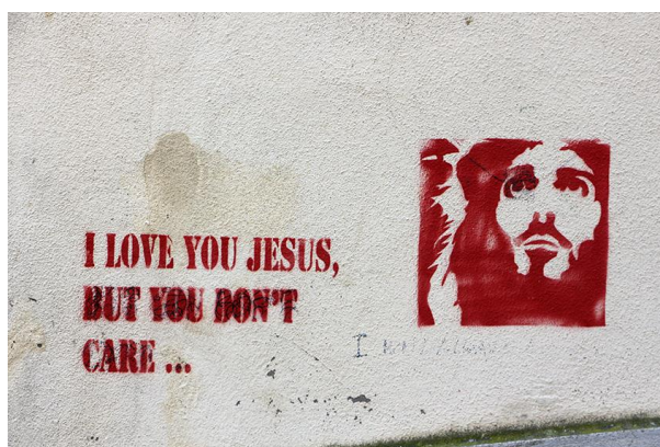
Figura 3. Inscrição do rosto de “Jesus” e frase em Língua inglesa

A inscrição da Figura 3 foi encontrada perto da Capela de São Salvador. A sua colocação na parede junto ao chão do passeio dificulta a sua leitura, pois a inscrição só fica visível de uma posição cabisbaixa, reclinada ou estendida no chão.