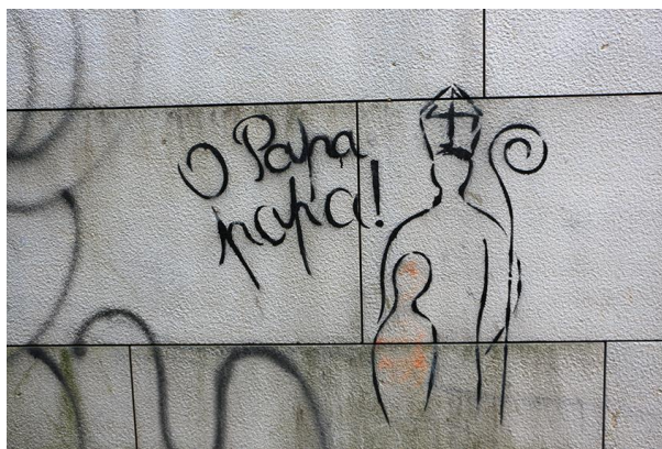
Figura 4. Inscrição do “Papa”

Em suma, o valor semiótico desta inscrição é elaborado a três níveis: na interação entre o linguístico e o visual, onde a mensagem subjacente fica consolidada na imagem, na interação com o meio envolvente – colocada na parede da Capela de São Salvador, centra a interpretação na imagem de Jesus e, finalmente, ao dificultar a sua leitura, impossibilita o diálogo em pé de igualdade e acaba por reforçar a mensagem de decepção e de indiferença.