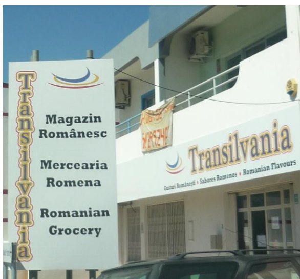
Figura 6. Almancil

Romanian Flavours » (Figura 6). Embora os letreiros sejam visualmente equilibrados em termos da importância dada a cada uma das línguas pelo design gráfico (o mesmo tipo de letra, a mesma cor e o mesmo tamanho para os textos nas três línguas), a ordem em que as três línguas são apresentadas pode sugerir algo sobre a hierarquia de importância dos recetores pretendidos da mensagem.