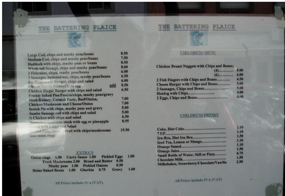
Figura 3. Almancil

Num período de cinco anos (2007-2012), observei, fotografei e cataloguei os outdoors e mupis num total de 15 quilómetros de estradas nos arredores de Almancil. Para além dos outdoors que faziam marketing de atrações e eventos turísticos, campos de golfe, restaurantes locais, etc., grande parte anunciava serviços de imobiliárias. Mais uma vez, a língua dominante era o inglês, com grande parte dos sinais só em inglês (Figura 4), mesmo que esta prática seja proibida pelo Regulamento da Actividade Publicitária na área do Município de