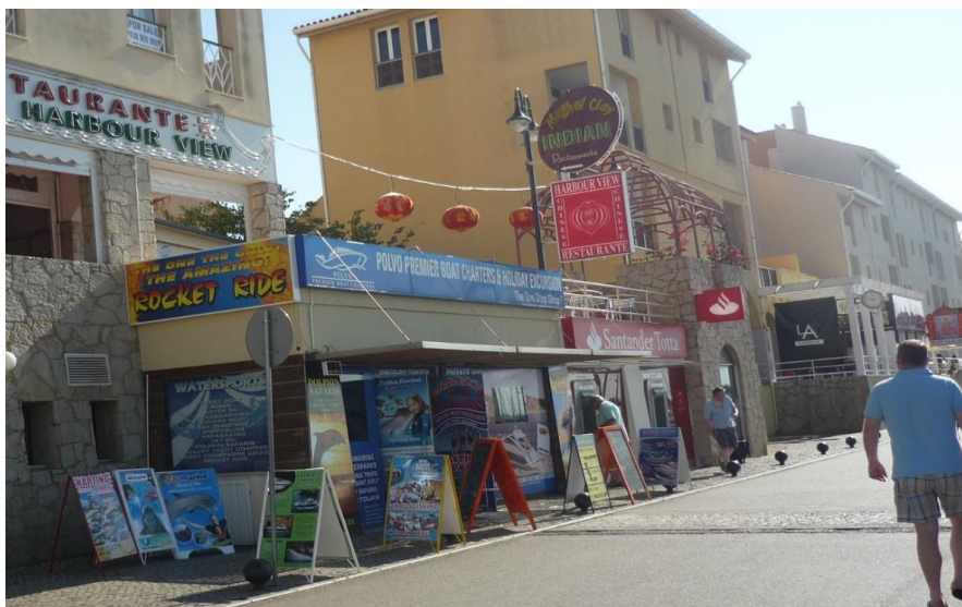
Figura 1. Marina de Vilamoura

Enquanto outras línguas (que, de acordo com as nacionalidades dos visitantes de Vilamoura poderiam incluir o alemão, o espanhol, o francês e o russo) não estão obviamente presentes nesta paisagem – o que significa que o inglês é enquadrado como a língua dominante de comunicação neste espaço –, também se observa que a geografia turística do Algarve tende para a formação de enclaves dominados por certas nacionalidades. Vilamoura é principalmente conhecida como um destino turístico para o mercado britânico, enquanto noutras áreas do Algarve, há um número maior de alemães ou espanhóis. Nessas outras áreas, essas línguas estão mais visíveis na paisagem.