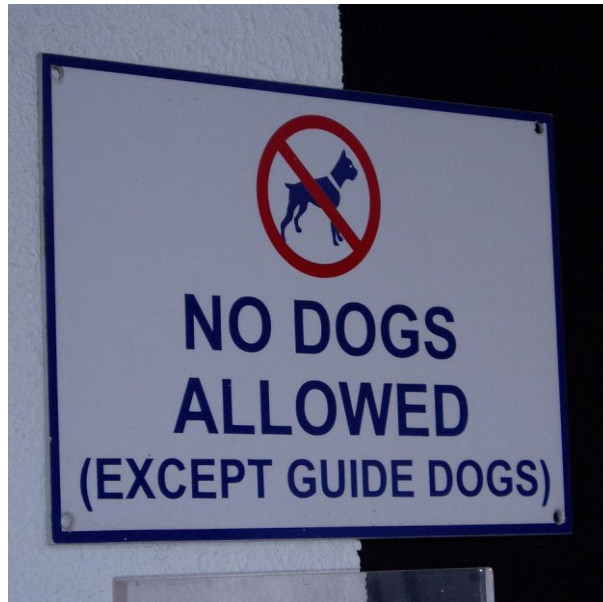
Figura 2. Almancil