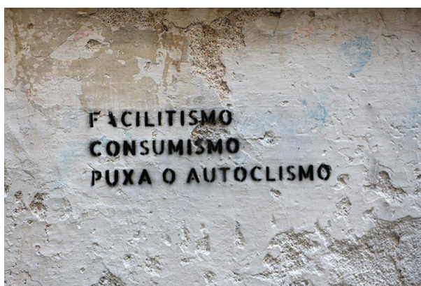
Figura 5. Inscrição sobre os valores

A inscrição da Figura 5 encontra-se numa zona histórica com prédios degradados, mais afastada da Universidade. Em comparação com as outras inscrições, o modo linguístico desta inscrição oferece poucas pistas concretas quanto à sua autoria ou à identidade do/a leitor/a imaginado/a, pois o texto “facilitismo, consumismo, puxa o autoclismo” pode originar de uma pessoa ou qualquer grupo que luta contra esses fenómenos na sociedade portuguesa. Pode-se observar que o/a autor/a é uma pessoa resoluta e com convicções firmes, por ter planeado e preparado todas as fases do processo de colocação da inscrição em questão: encontrou a rima (facilitismo-consumismo-autoclismo), formatou o texto de maneira a caber no stencil e parecer simétrico, recortou o stencil e imprimiu a mensagem na parede. O modo linguístico constrói, assim, o significado a dois níveis: no plano léxico, com base no contraste entre o abstrato (valores e orientações sociais) e o concreto (autoclismo), entre o imaterial e material, bem como no plano simbólico, no apelo de acabar com essas orientações, livrando-se delas de uma vez por todas.