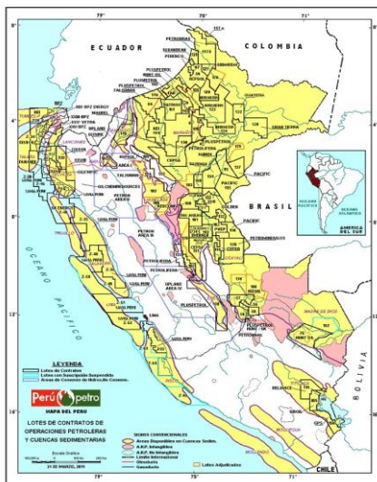
Lotes de hidrocarburos en Perú, 2011.

Ese mismo día, el diario El Mundo publicó una información a toda página cuyo titular fue: “Masacre en la selva peruana”. A diferencia del anterior, no se señala ni a las víctimas ni a los victimarios.