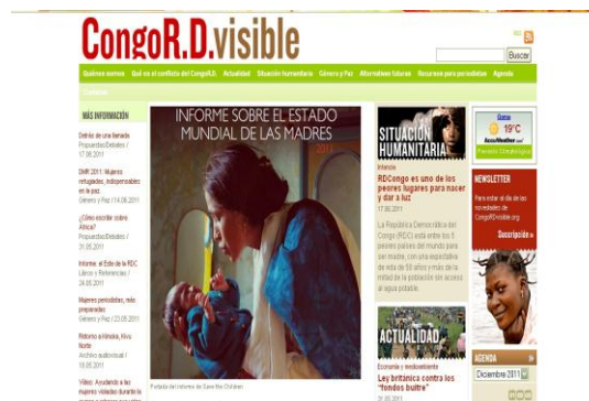
Herramienta virtual especializada en el conflicto de la República Democrática do Congo (RDC). ACNUR Euskal Batzordea.

Desde 2006, ACNUR Euskal Batzordea (AEB) realiza un análisis cualitativo de la cobertura mediática de los llamados conflictos olvidados, por su escasa atención internacional, como lo son el conflicto de Darfur (Sudán) o la República Democrática del Congo. Su tarea se concentra principalmente, por campo de acción, en la prensa escrita de difusión en el País Vasco, aunque se han observado también periódicos impresos y digitales en castellano e inglés de distintos países de Europa, África y Asia, con resultados coherentes.