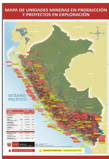
Explotaciones mineras y proyectos en exploración, Perú, 2011.

Uno de los más importantes instrumentos para monitorizar la conflictividad en el Perú es el Reporte de Conflictos Sociales que elabora la Defensoría del Pueblo. En su último informe, del mes de Junio de 2011, esta institución identifica que en el territorio peruano existen 217 conflictos sociales en activo, de los cuales el 55,4%, 118 situaciones, corresponden a conflictos socioambientales derivados de la explotación minera y de hidrocarburos con perjuicio de la población y sus recursos naturales.