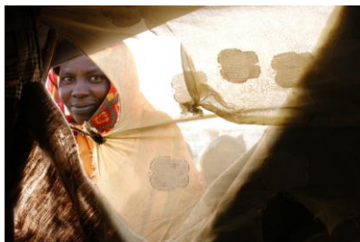
Mujer refugiada en el campo de Iridmi, al oriente de Chad.

asunto de hombres. Un asunto en el que las mujeres están involucradas sólo de dos maneras: como víctimas pasivas o perpetradoras involuntarias de violencia; y desde luego sin que parezcan tener opinión sobre la situación ni propuestas para la paz. Un sencillo contraste de esta imagen con fuentes diversas se hace enseguida evidente que esta perspectiva no es real y requiere un cambio.